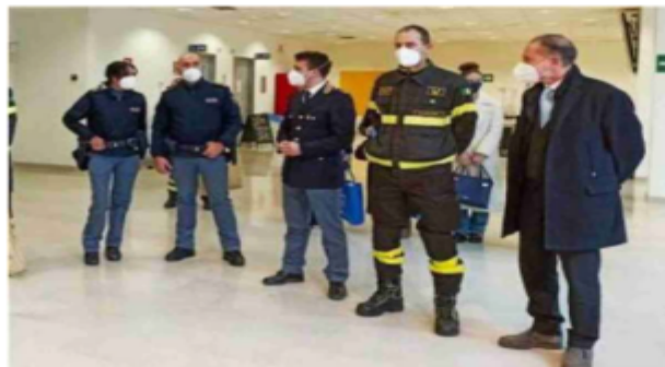
La visita del questore al San Luca