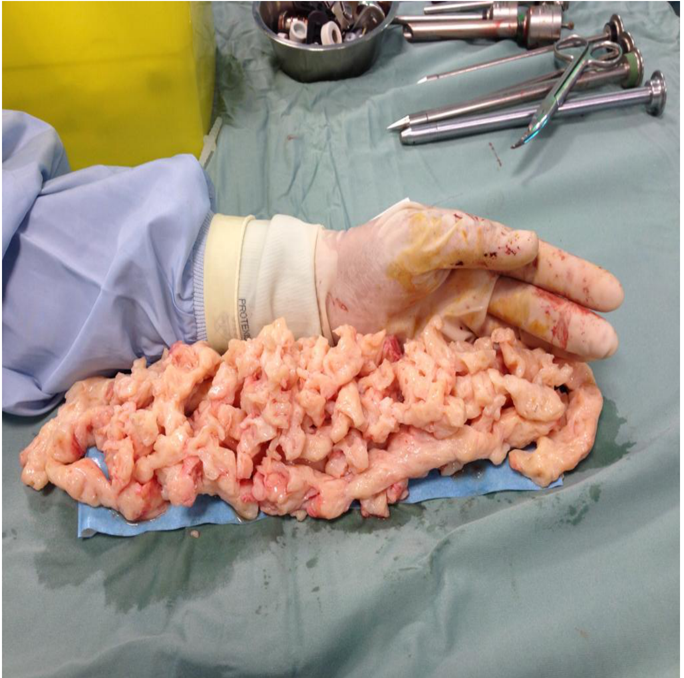
Figura 2. Mioma uterino di grandi dimensioni morcellato.

Per morcellazione si intende la frammentazione di un campione di tessuto solido in porzioni più piccole, in modo da permettere la sua estrazione tramite incisioni cutanee di piccole dimensioni (Figura 2).