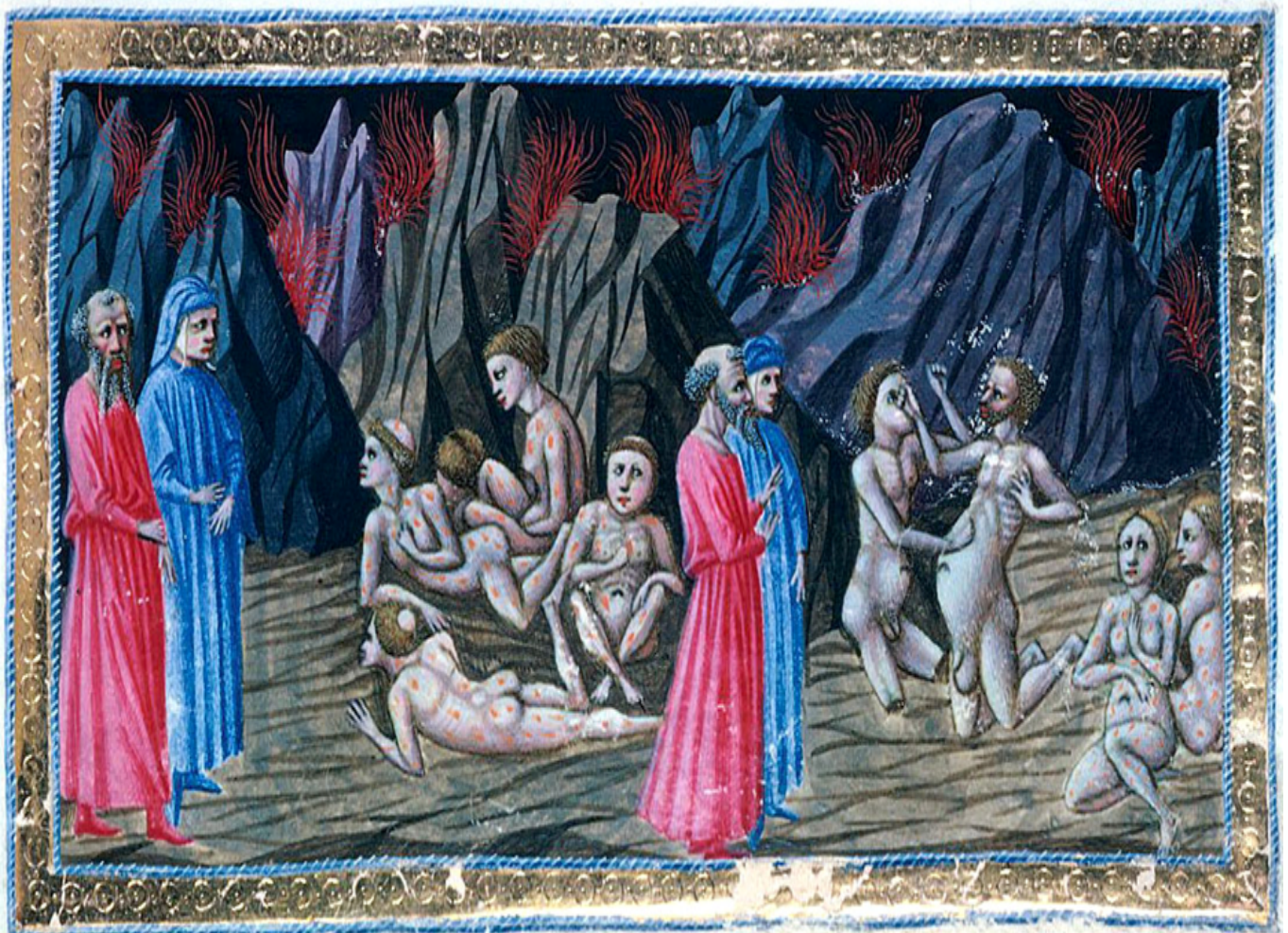
Priamo della Quercia: La rissa tra Mastro Adamo e Sinone – vv. 100-148