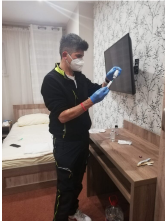
La terapia nell'alloggio di fortuna a Rzeszow in attesa del volo di rientro in Italia