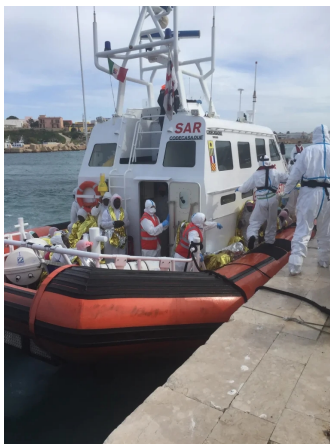
Sul molo Favalaro a Lampedusa

2017 – Missioni a Lampedusa per l'assistenza pediatrica agli sbarchi dei migranti e supporto all'assistenza pediatrica territoriale;