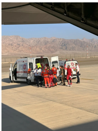
L'arrivo delle ambulanze con i bambini di Gaza all'aeroporto di Eilat Ramon in Israele

2025 (giugno) – Operazione MEDEVAC da Israele di pazienti pediatrici provenienti dalla Striscia di Gaza;