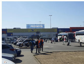
Centro commerciale vicino alla frontiera Polonia/Ucraina convertito in centro di accoglienza per i profughi ucraini