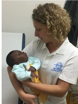
Sguardi di intesa!

2019 e 2022 – Assistenza sanitaria pediatrica in occasione del Jova Beach Party a Viareggio;