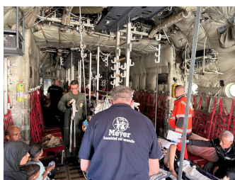
Si sorvegliano i pazienti durante il volo verso l'Italia

2025 (febbraio) – Operazione MEDEVAC dall' Egitto di paziente pediatrico proveniente dalla Striscia di Gaza;