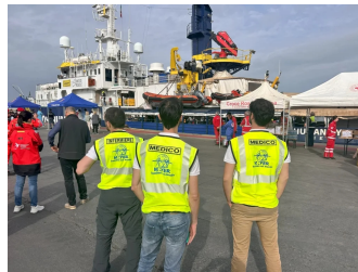
In attesa dello sbarco