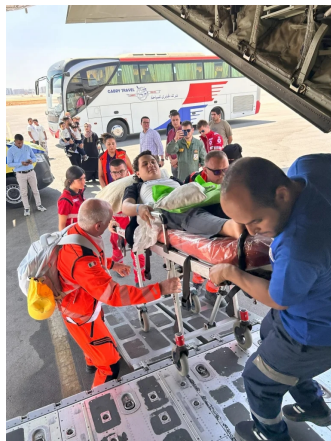
L'imbarco dei pazienti all'aeroporto militare de Il Cairo