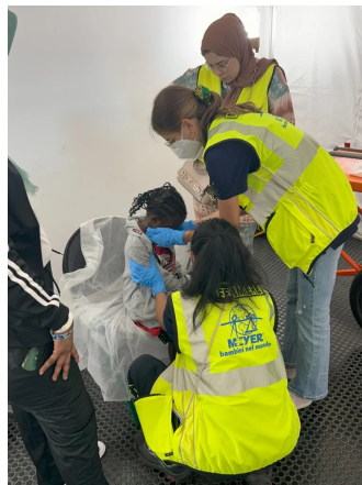
Visita medica dopo lo sbarco