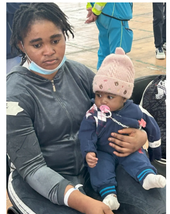
In attesa dopo lo sbarco

2024 – Partecipazione al Team di Scouting/Assessment in Egitto per operazione MEDEVAC di pazienti pediatrici provenienti dalla Striscia di Gaza;