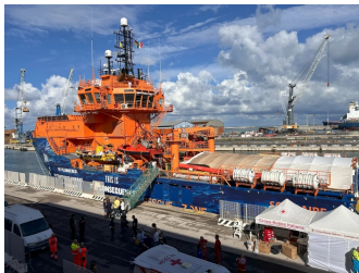
Il rescue vessel SOLIDAIRE al porto di Livorno

2022 – 2023 – 2024 – 2025 – Assistenza sanitaria pediatrica durante lo sbarco di migranti dalle navi di ricerca e soccorso nei porti di Livorno e Carrara;