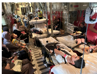
In volo sul C 130