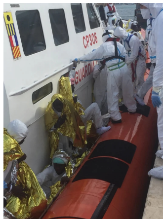
Sbarco di migranti a Lampedusa