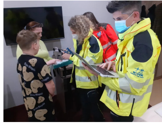
La raccolta dati dei pazienti ucraini