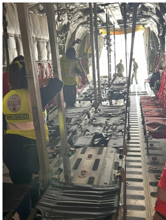
Le barelle all'interno del C 130 della 46° Brigata Aerea di Pisa