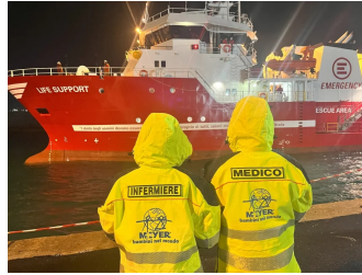
"Bambini nel mondo"

È composta da professionisti sanitari (medici ed infermieri) che su base volontaria garantiscono la disponibilità 24/365 in caso di attivazione da parte delle strutture regionali o nazionali di Protezione Civile per situazioni di maximergenza di qualsiasi natura. Inserita infatti nel meccanismo regionale di Protezione Civile, ha permesso la configurazione del Posto Medico Avanzato (PMA) di Regione Toscana come struttura campale di II livello, attualmente l'unica in Italia dotata di specifiche competenze professionali in campo pediatrico. Il Team in turno di reperibilità è composto da un coordinatore, un pediatra, uno specializzando della Scuola di Specializzazione in Pediatria dell'Università degli Studi di Firenze ed un infermiere.