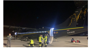
L'ATR 72 della Guardia di Finanza a Rzeszow in attesa del rientro in Italia con i pazienti e il team sanitario del Meyer

2022 – 2023 – 2024 – 2025 – Assistenza sanitaria pediatrica durante lo sbarco di migranti dalle navi di ricerca e soccorso nei porti di Livorno e Carrara;