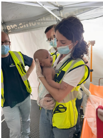
Accoglienza dopo lo sbarco