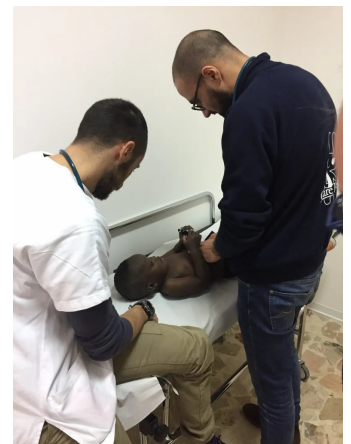
Visita medica dopo lo sbarco