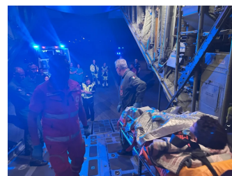
L'arrivo a Pisa

2025 (agosto) – Operazione MEDEVAC da Israele di pazienti pediatrici provenienti dalla Striscia di Gaza.