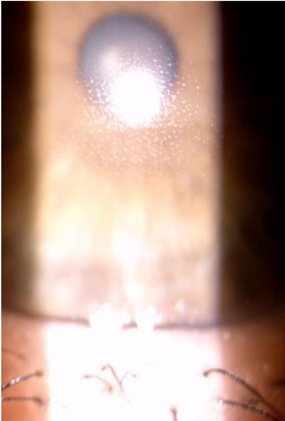
Figura 2. Ridotta bagnabilità della superficie della LAC dopo applicazione.

Strategia di supporto: Instillazione di Blu Yal A ® (sostituto lacrimale con acido ialuronico sale sodico 0,15% ad alto peso molecolare (FHA 1.0) e aminoacidi, senza conservanti), 3 volte/die in fase di allenamento e fino a 5 volte/die nei giorni di gara, con instillazione immediata pre-gara.