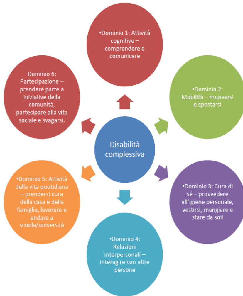
Fig. 7: domini di funzionamento in riferimento all'ICF.